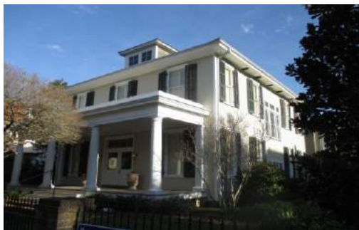
Arquitectura representativa del GARDEN DISTRICT

Tomamos el Bus Turístico, el cual dio primero una vuelta por GARDEN DISTRICT, donde se localizan muchas de las mansiones tradicionales de la ciudad, el famoso Cementerio Lafayette, luego hicimos un recorrido por "Mardi Gras World", que es una ciudadela donde se exhiben contenidos de su famoso carnaval en mas de 27 bodegas. El Bus nos paso frente al Convention Center de New Orleans, el cual según el guía turístico es el segundo mas grande de Estados Unidos y se levanta a orillas del Mississippi River. El recorrido del Bus continuo frente a Jackson Square, que habíamos visitado el día anterior, pasamos frente al French Market y durante 15 minutos estacionamos en el Terminal Turístico de la ciudad, donde hay cafetería, colección de mapas históricos de la ciudad y venta de souvenirs para los visitantes.