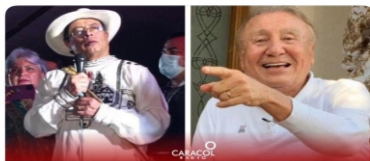
"Invito a Rodolfo Hernández a unirse al Pacto Histórico": Petro

4:52 p.m. · 4/12/21 · Twitter for Android