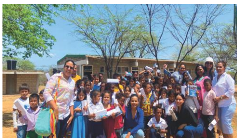
Personas beneficiadas con la puesta en marcha del proyecto de abastecimiento de agua potable.

“Es importante realizar este tipo de proyectos, ya que establecen lazos de cooperación y