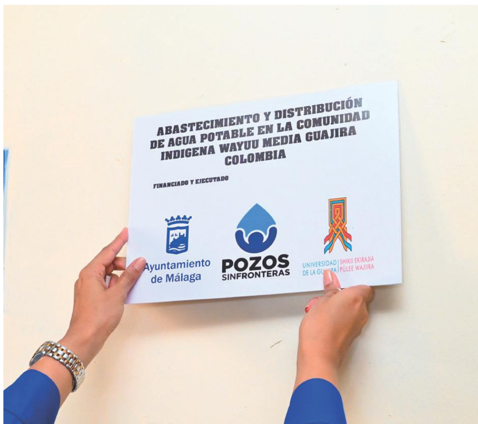
Placa instalada en la sede del Centro Educativo Luis A. Brito de Barrancón durante la entrega del proyecto.

Cabe resaltar, que con la puesta en marcha de estas iniciativas y el fortalecimiento de las alianzas interinstitucionales, la Universidad de La Guajira ratifica su compromiso con las poblaciones en condiciones de vulnerabilidad y su interés de aportar a la disminución de los índices de morbilidad por enfermedades asociadas a la ausencia de agua, mediante la producción científica y la proyección social.