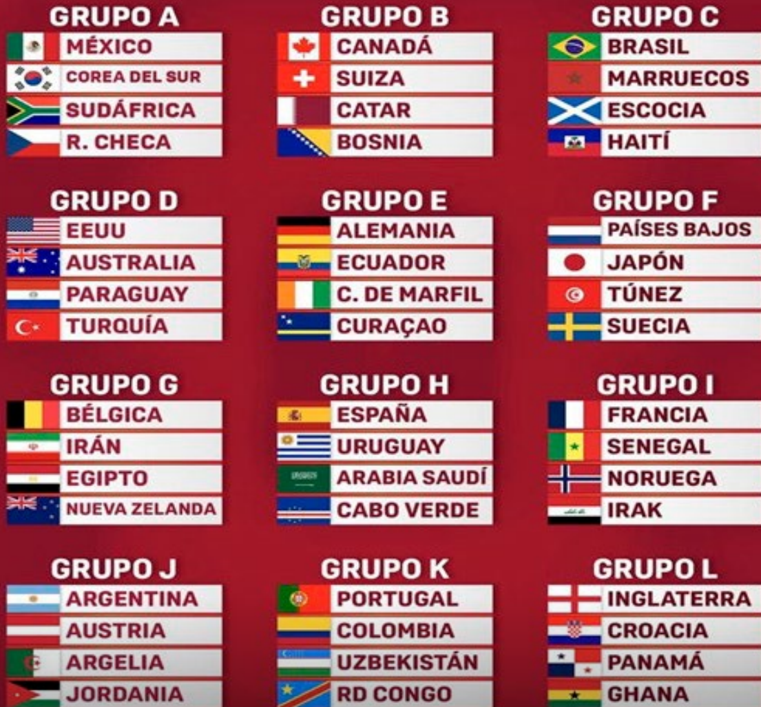
FOTO: Mundial 2026

Sus fallos han sido una demostración de "lo que no se debe hacer". Una falta de gol que asusta, una dependencia excesiva de un sistema que los rivales ya estudiaron, se siente como soberbia la táctica de creer que el "Catenaccio" en defensa y un contraataque evolucionado, les alcanzaría para pasar por encima de selecciones que hoy en día corren el doble y juegan notablemente mejor, aun cuando sean las cenicientas del baile. Italia falló en los momentos clave, en esos partidos donde antes sacaban el oficio y ahora solo sacan excusas. Es triste, sí, pero el fútbol no espera a nadie, ni siquiera a los cuatro veces campeones. Bolivia: El síndrome del "Mal de Altura"