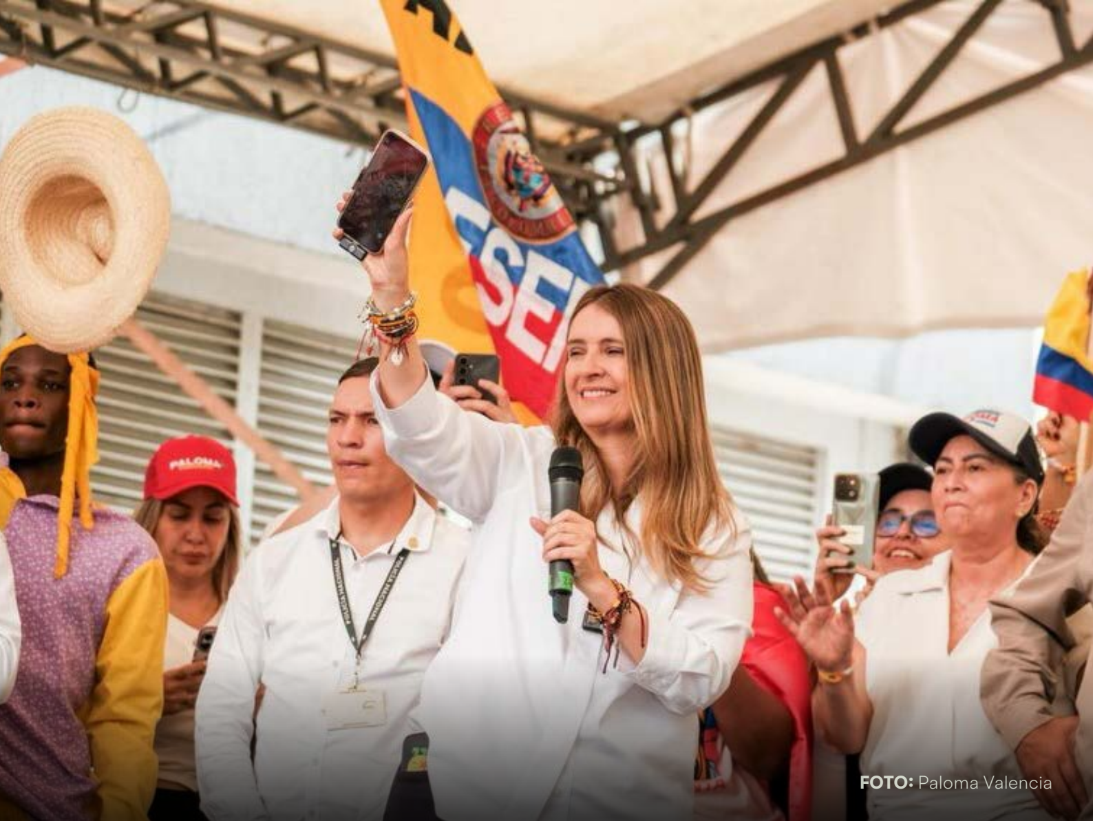
FOTO: Paloma Valencia

El tigre se apoya en los uribistas desertores y torcidos, los godos conservadores, militares en retiros, los antioqueños con Fico, algunos llaneros y pastores de cultos cristianos y religiosos. En principio anunció que se lanzaba a la presidencia, como candidato de los pobres, cuando no conoce lo rigores de pobreza y detesta de ella. Otra mentira, porque para todo los que los conocen, no lo niegan, ni extraña, su participación como miembro de la derecha. Ahora para simular manifiesta que es de los “nunca” y no va ligarse con los de siempre, rechazando a militantes de otros partidos que les ofrecen apoyo. La familia Char, prepararon con sus seguidores, una manifestación pública de adhesión al tigre en Barranquilla, pero fue rechazada por motivo de compromiso entre clanes políticos. Por causa del desprecio los Char, estos apoyaran a la candidata Paloma Valencia. Las campañas políticas, se ganan con votos, no